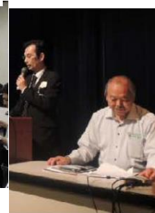
(参考) 2014J 会場風景