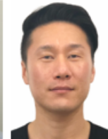
SAMIN E&S バクジュソン